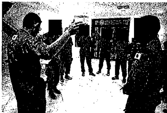
業支隊の大使館意見交換会前の打ち合わせ