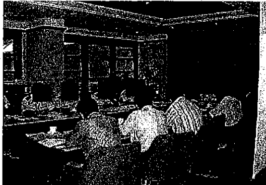
ムバラク空港からクウェート空港へのスポット変更事案に関する業者との検討会