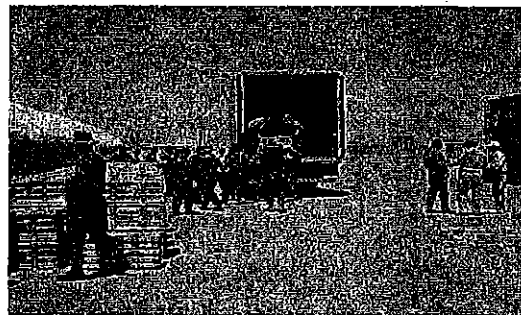
帰国第3波約280名分の個人コンテナの集荷