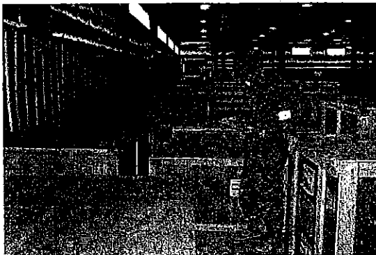
ファルアニア倉庫における10次群への追送品の状況