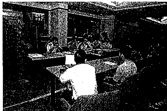
曹友会会同の実施状況