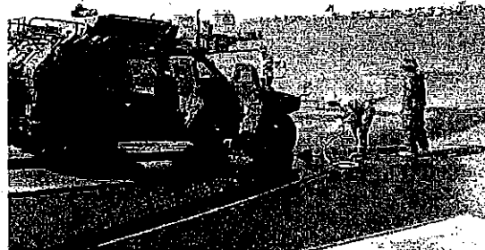
PWC洗車場における車両の1次洗浄の状況