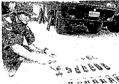
[ ]倉庫において車両からお守りの取り外し