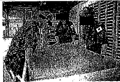
ファルアニア倉庫から[ ]倉庫への物品の移送 (10次群用追送部品等)