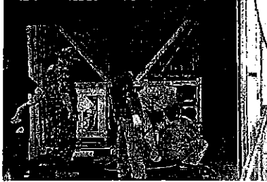
倉庫におけるコンテナ詰め