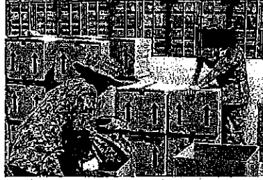
倉庫においてRSU保有装備品の整理・確認