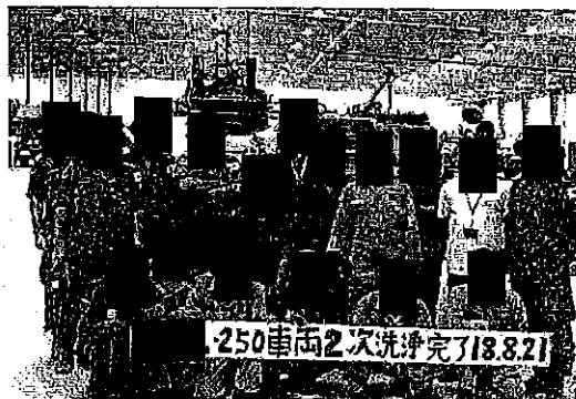
倉庫における車両の2次洗浄終了