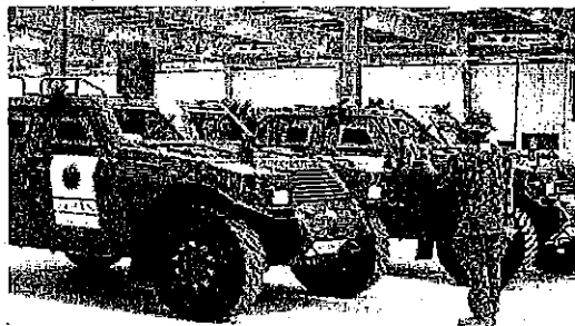
シュワイク港搬入前の車両点検