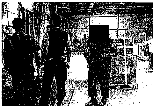
倉庫におけるコンテナ詰め