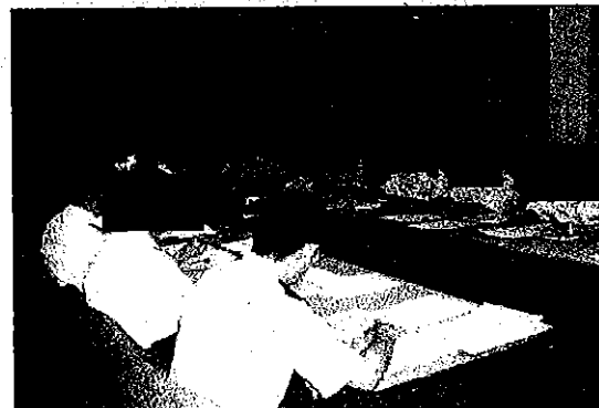
#3活動成果報告検討会