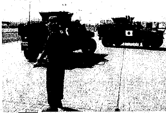
倉庫における車両配列及び車両点検