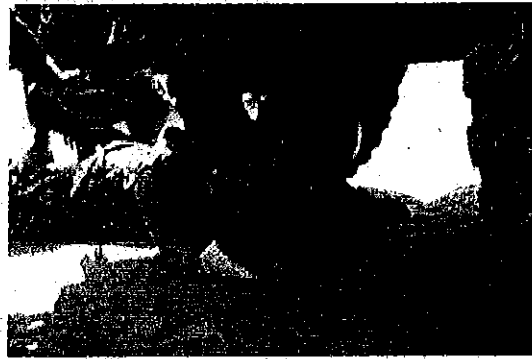
倉庫における車両配列及び車両点検