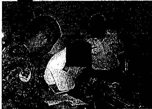
個人コンテナの検数・検量